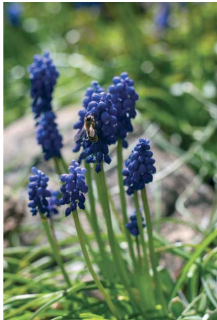
Traubenhyazinthen sind attraktive Hin- und weglocker und vertreiben Wühlmäuse.

Jetzt treten vermehrt die Schadinsekten auf. Die weiße Fliege befällt im Freiland bevorzugt Kohlpflanzen. Die Pflanzen können Sie mit Schädlingsschutznetzen vor den lästigen kleinen Tierchen schützen. Die Netze müssen an den Rändern dicht sein. Dazu werden sie mit Erde bedeckt. Auch Gelbsticker sind zum Abfangen dieser Schadinsekten geeignet.