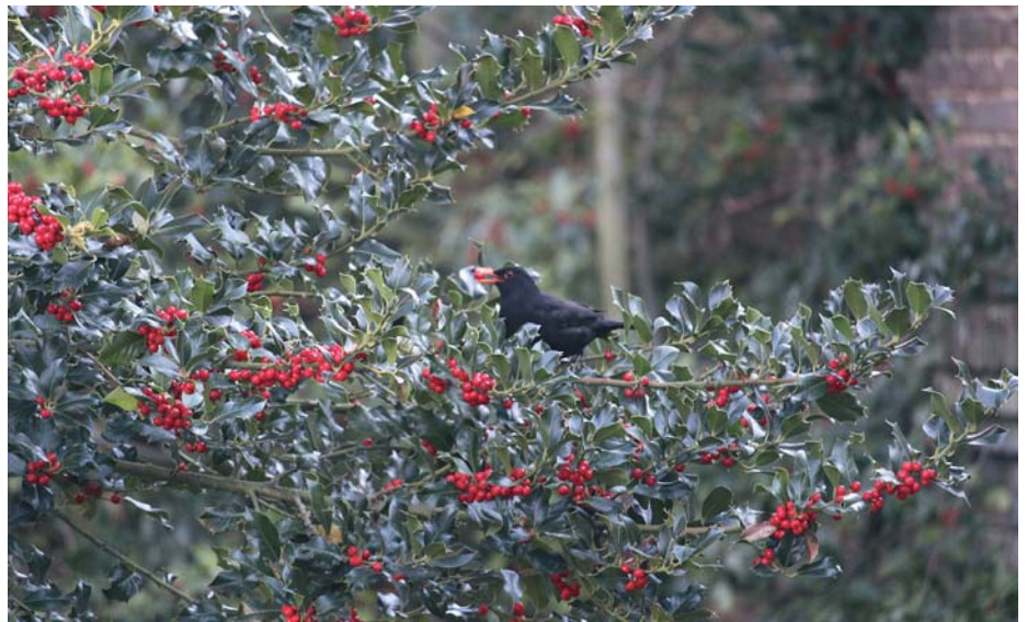
Die Früchte der weiblichen Stechpalme sind schwach giftig. Vögel fressen sie meist nur, wenn kein anderes Angebot verfügbar ist.

Der beliebte Spielplatz in der Anlage des Kleingärtnervereins „An der Dammstraße“ e.V. wird erneuert; allerdings beginnen die Arbeiten erst im Frühjahr 2022. Derzeit bereitet das Amt für Stadtgrün und Gewässer in Abstimmung mit dem Verein die Arbeiten vor. Zwei verschlissene Spielge-