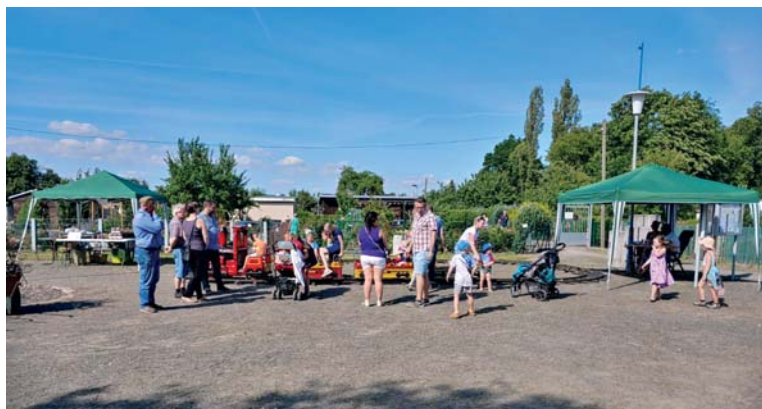
Auf der Freifläche vor der Vereinsgaststätte ist viel Platz für ein begehbares Schachspiel.

Es wurde allerdings nicht nur am 17. April gearbeitet. Mit viel Engagement der Gartenfreunde konnte an der Hohentichelnstraße 90 Meter Außenzaun schrittweise erneuert werden.