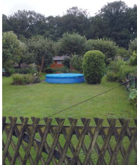
Rechtswidrige Idylle: Eine solche Gestaltung der Parzelle widerspricht eindeutig den Bestimmungen des Bundeskleingartengesetzes.