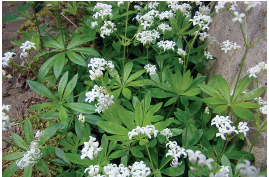
Wenn der Waldmeister blüht, sollte die Ernte abgeschlossen sein, denn von diesem Zeitpunkt an wird der Cumarin Gehalt zu hoch.

Vom Wackelpudding kennt jeder den Duft und den Geschmack. Frischen Waldmeister liefert uns der Kleingarten. Im Mai wird er zuweilen auf Märkten und in manchen Gemüsegeschäften angeboten. Getrocknet kann man ihn nicht kaufen, obwohl Waldmeister erst nach seinem Tod auflebt. „ Wenn die Pflanze dahingewelkt ist, spendet sie den Hauch ihres Opfers: prickelnden, in Wein geborenen Maienduft ... “, formulierte der