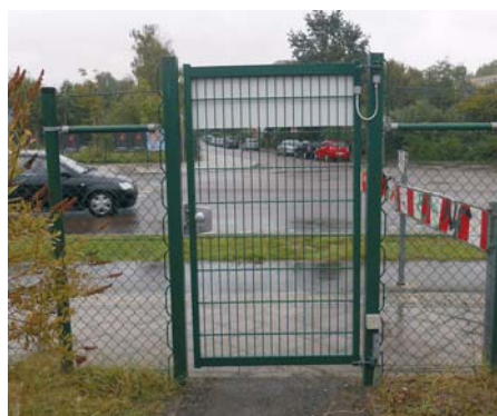
Zu den förderfähigen Präventionsmaßnahmen zählen automatische Schließanlagen für Tore.

Grundlage dafür ist die vom Stadtrat beschlossene „Fachförderrichtlinie der Stadt Leipzig über Förderung des Garten- und Kleingartenwesens“ (s. Kasten oben rechts). Sie gilt für alle KGA auf dem Territorium der Stadt Leipzig und muss bei Antragstellung beim Amt für Stadtgrün und Gewässer konsequent beachtet werden. So ist unter 2. (2) u.a. festgelegt, dass Maßnahmen förderfähig sind, die der Erhöhung der Sicherheit in KGA und dem Schutz des Gemeinschaftseigentums mit dem Ziel einer deutlichen Erhöhung des Sicherheitsstandards