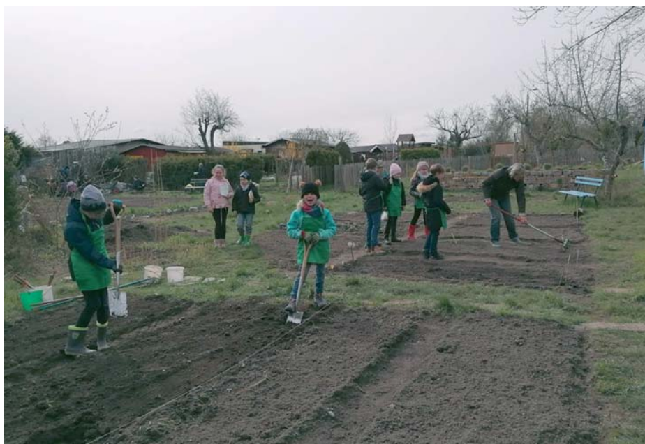
Aus fünf verwilderten Kleingärten entstand ein toller Schulgarten.

Jetzt, nach fünf Jahren, ist der Schulgarten sehenswert. Er wird ausschließlich nach ökologischen Gesichtspunkten bewirtschaftet. Eine Totholzhecke lädt die Kinder zu intensiven Beobachtungen ein. Ihre Pflanzen ziehen sie teilweise selbst im Gewächshaus. Die gesammelten Erkenntnisse können die Kinder in ihren Beobachtungs-