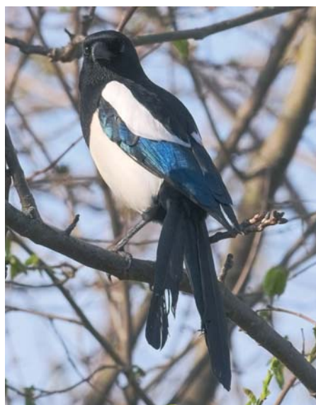
Ein attraktiver Nesträuber: die Elster.

ihre Nester in sehr unterschiedlichen Höhen an, von wenigen Zentimetern über dem Erdboden in niedrigen Büschen und dornigen Hecken (Weißdorn, Schlehe) bis zu den höchsten Wipfeln riesiger Eichen, Buchen und Pappeln. Die Nestunterlage besteht aus sperrigen Zweigen, darauf wird ein haubenförmiger Bau aus dornigen Zweigen mit seitlichem Schlupfloch errichtet. Der Nestnapf ist aus Lehm und mit feinen Würzelchen ausgelegt.