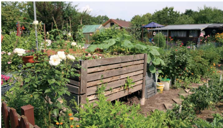
Mit wenig Aufwand lässt sich ein Kleingarten naturnah und ressourcenschonend gestalten. Der BDG will dazu Anregungen geben.