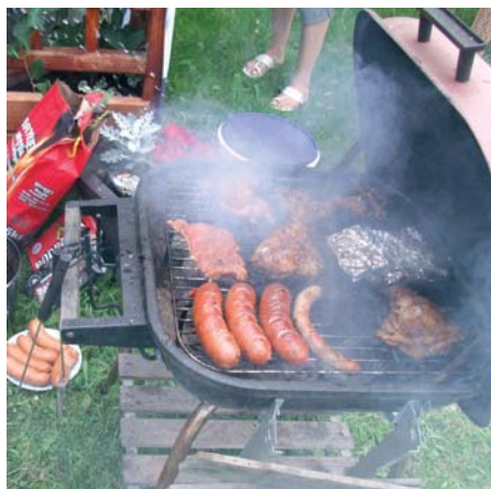
Grillasche ist oft belastet und gehört nicht auf den Kompost.

Einige Schwermetalle, wie Nickel, Kupfer, Zink und Eisen, zählen zu den essenziellen Nährstoffen für Pflanzen und Tiere und kommen überall in unserer Umwelt vor. Allerdings sind sie nur in diesen kleinen Konzentrationen unbedenklich.