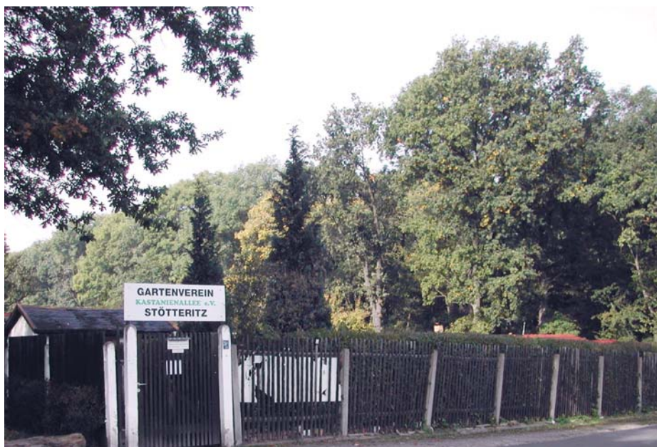
Der Haupteingang an der Pommernstraße.

Quelle: Geschichte, Entwicklung und Gegenwart Leipziger Kleingärten, 1919 bis 1932, Stadtverband Leipzig der Kleingärtner e.V., Broschüre 4 Teil 2